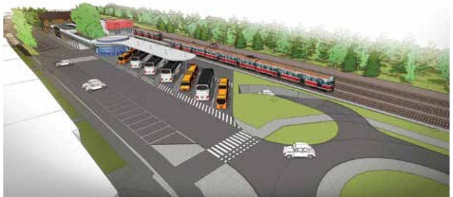
Koncepcja, która uzyskała najwyższą ilość punktów w konkursie. Opracowanie: Architektoniczna Pracownia Autorska Jerzy Gurawski z Poznania.