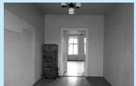
Lokal mieszkalny przy ul. Górnej przeznaczony do sprzedaży.

Wykaz nieruchomości przeznaczonych do zbycia został wywieszony na tablicy ogłoszeń Urzędu Miejskiego w Cieszynie /Rynek 1, I piętro/ na okres od dnia 26 lutego 2014 r. do dnia 18 marca 2014 r.