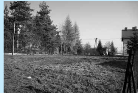
Niezabudowana działka przy ul. Gminnej przeznaczona na sprzedaż.

Burmistrz Miasta Cieszyna ogłasza, że w dniu 7 kwietnia 2014 r. w sali nr 13 Urzędu Miejskiego w Cieszynie (Rynek 1, I piętro) o godz. 10.00 odbędzie się drugi ustny przetarg nieograniczony na sprzedaż niezabudowanej nieruchomości gruntowej położonej w Cieszynie przy ulicy Gminnej , oznaczonej jako działka nr 8/8 obr. 21 o pow. 0,0748 ha , zapisana w księdze wieczystej nr BB1C/00052547/3 Sądu Rejonowego w Cieszynie.