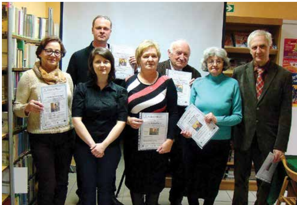
Absolwenci kursu komputerowego dla seniorów.