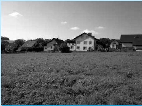
Działka przy ul. Bocianiej przeznaczona na sprzedaż.

Burmistrz Miasta Cieszyna ogłasza, że w dniu 7 kwietnia 2014 r. w sali nr 13 Urzędu Miejskiego w Cieszynie (Rynek 1, I piętro) o godz. 10.20 odbędzie się drugi ustny przetarg nieograniczony na sprzedaż nieruchomości gruntowej położonej w Cieszynie w rejonie ulicy Bocianiej , składającej się z działek nr 20/99 i 19/37 obr. 77 o powierzchniach odpowiednio 0,0346 ha i 0,0378 ha – razem 0,0724 ha , zapisanych w księdze wieczystej nr BB1C/00041515/0 Sądu Rejonowego w Cieszynie.