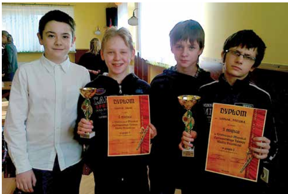
Uczniowie z SP 3 - uczestnicy Ogólnopolskiego Turnieju Wiedzy Pożarniczej w OSP Cieszyn-Bobrek.