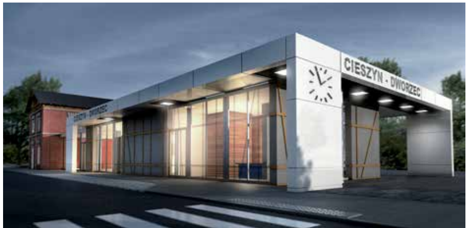
Koncepcja, która zdobyła najwięcej głosów internautów. Opracowanie: Mirosław Zięba Studio Projektowe z Nowej Dęby.