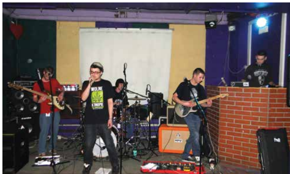
Pierwsze eliminacje Pojedynku Rocka zwyciężył zespół Fankatak.