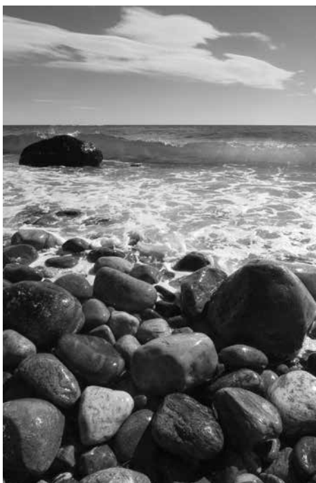
Na opowieść o połowie ryb na Morzu Norweskim zapraszamy 19 marca.