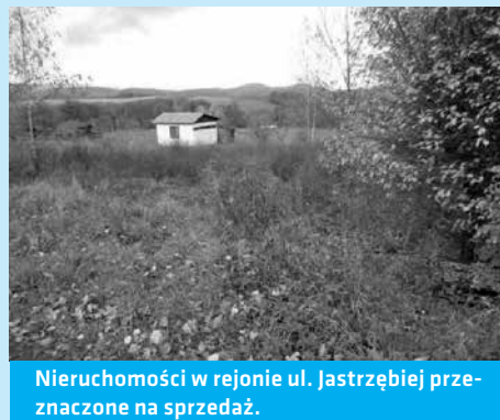
Nieruchomości w rejonie ul. Jastrzębiej przeznaczone na sprzedaż.

Blizszych informacji w tej sprawie można zasięgnąć pod numerem telefonu 33/4794 234, 33/4794 230.