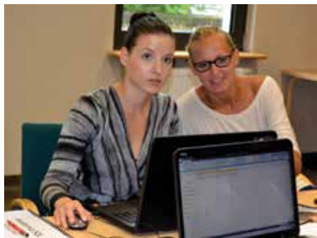
Na praktyczne szkolenie z tworzenia korespondencji seryjnej Zamek zaprasza 7 kwietnia.

Korespondencja seryjna to technika szybkiego tworzenia dokumentów, różniących się pojedynczymi elementami. Pozwala zaoszczędzić czas i ułatwia codzienną pracę.